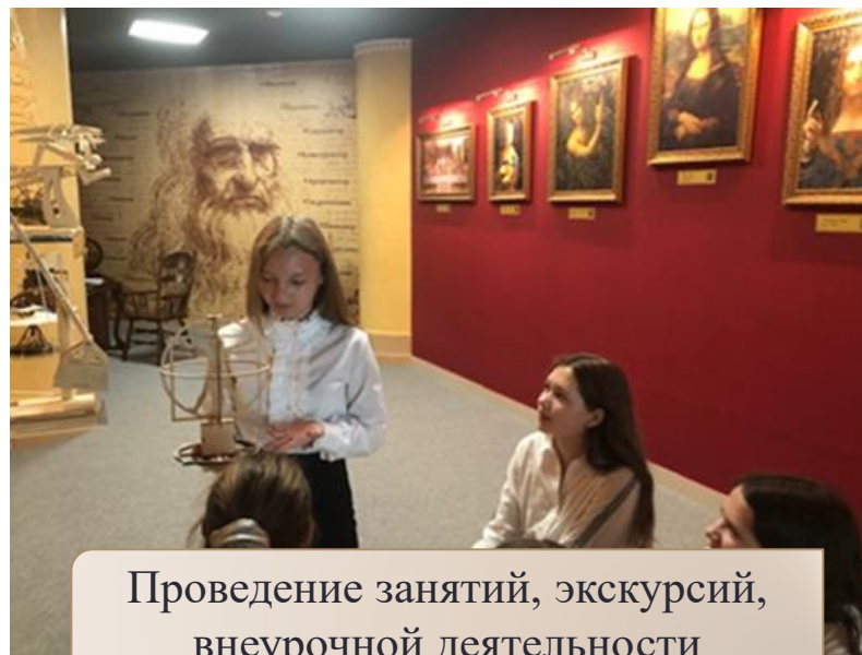
Проведение занятий, экскурсий, внеурочной деятельности