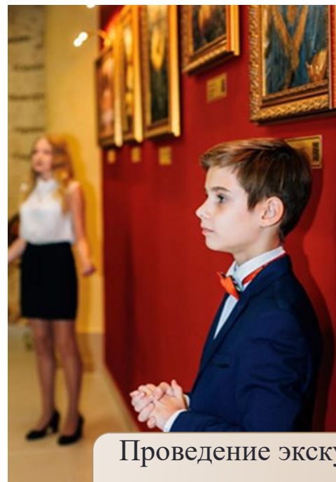
Проведение экскурсий, музейных уроков учащимися школы для обучающихся и гостей ЦО