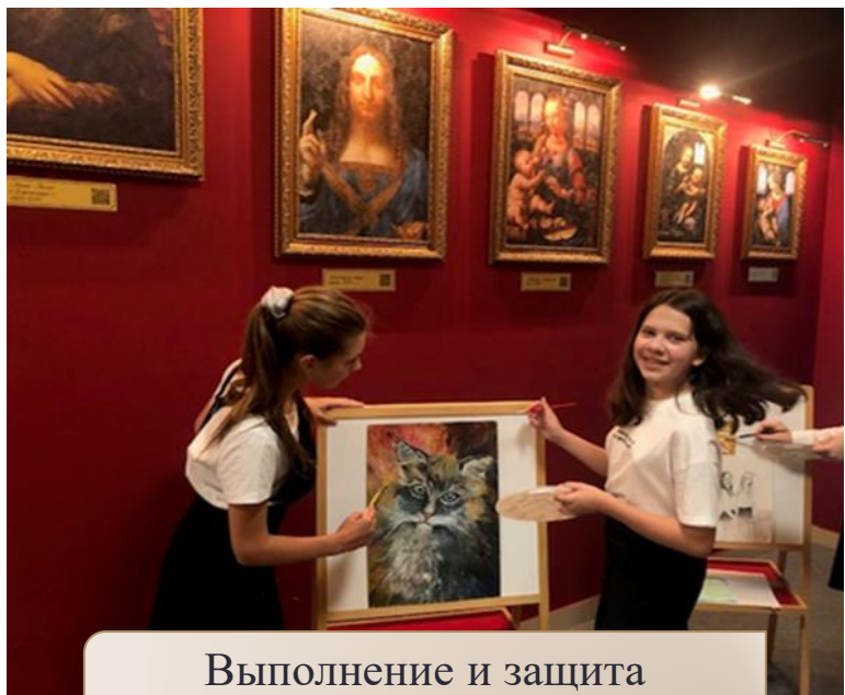
Выполнение и защита проектных работ