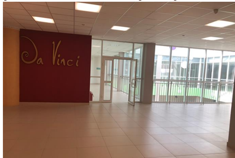
Расширение пространства за счет холла 3 этажа.